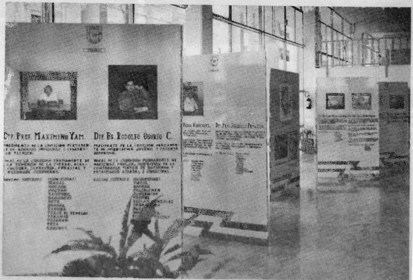
En el Congreso del Estado, instalados módulos de información sobre las actividades de los diputados.