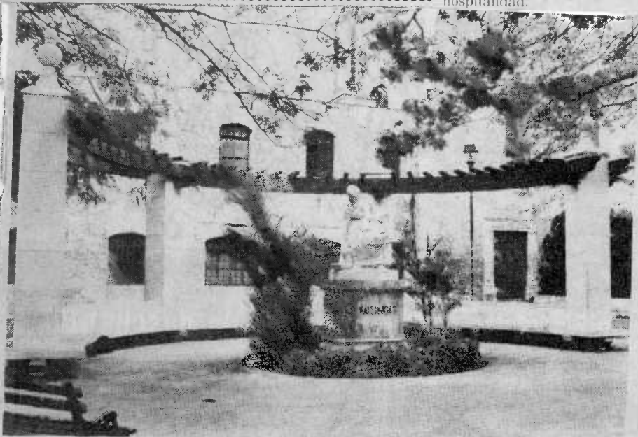
El Parque de la Madre presenta actualmente, casi sin cambios, la fisonomía que le dieron sus autores en 1928, como consta en esta gráfica.— (Foto de Isidro Avila Villacis)