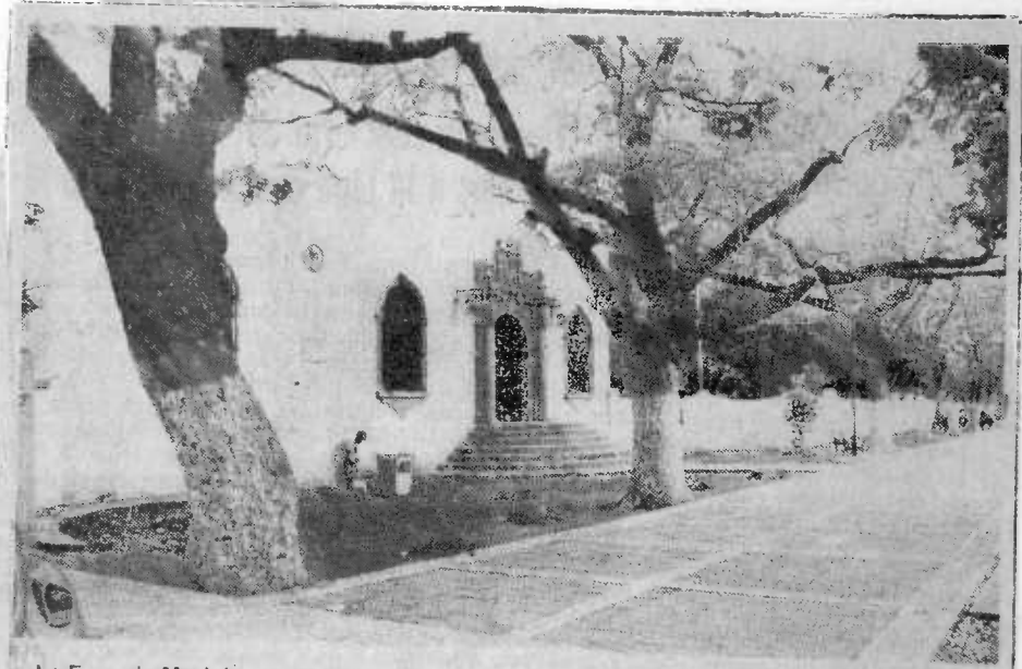
La Escuela Modeló, como se ve actualmente desde la perspectiva del Paseo Montejo